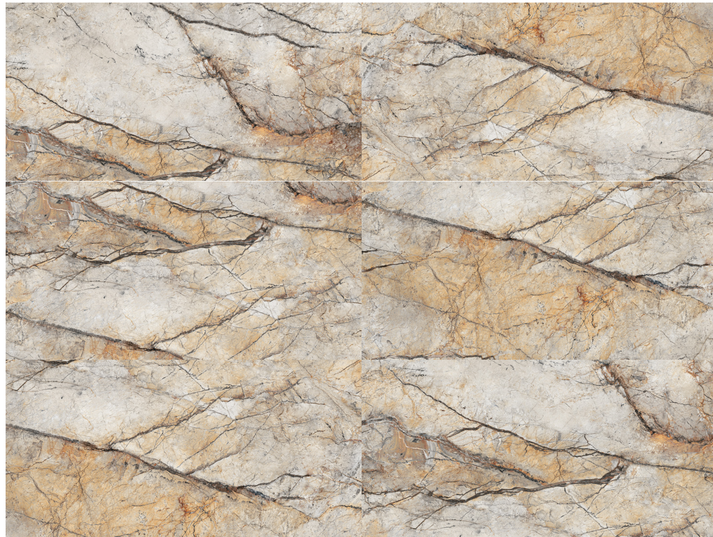
canion 60x120 rektyfikowana